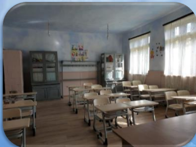
ȘCOALA PRIMARĂ, SAT LĂLEȘTI