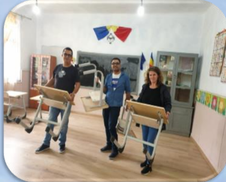
ȘCOALA PRIMARĂ, SAT LĂLEȘTI