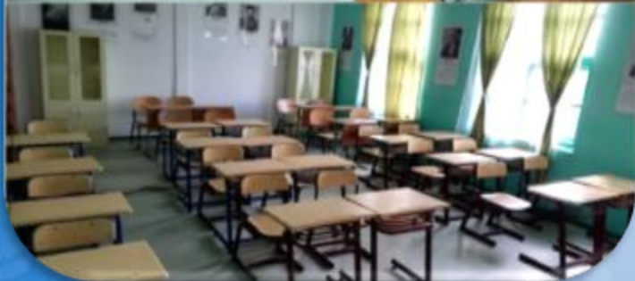
LICEUL TEHNOLOGIC, SAT PUIEȘTI